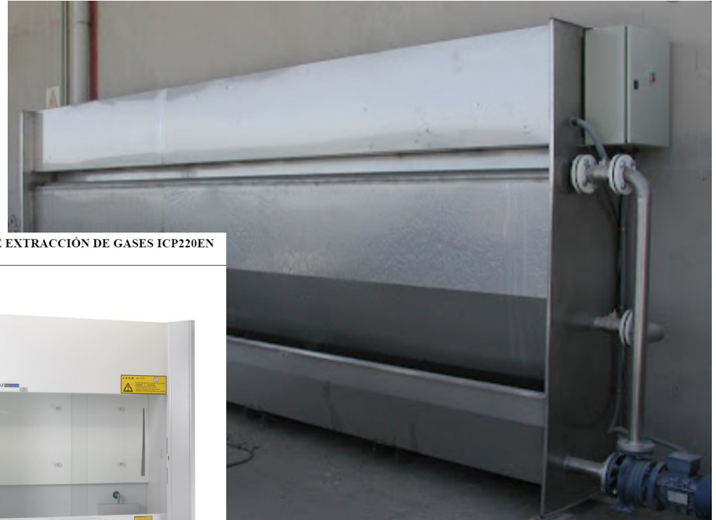
VITRINA DE EXTRACCIÓN DE GASES ICP220EN